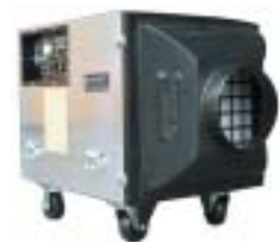
マンホールド装着例 (300φ)