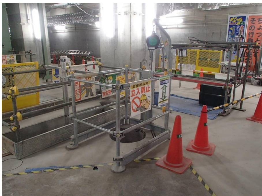
スライドバー仕様