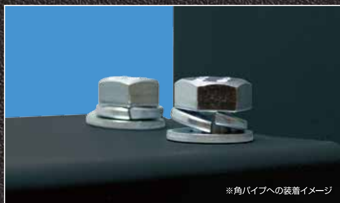
※角パイプへの装着イメージ